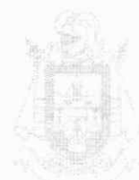
OSCAR ENRIQUE JARAMILLO JIMENEZ Alcalde Distrital de Barrancabermeja (E) Decreto Distrital No. 302 de 2026